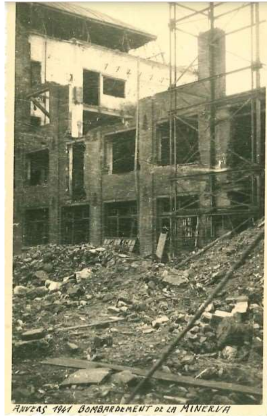
De gebombardeerde Minervafabriek in de Karel Oomsstraat in 1941

In het project zit ook de aanleg van de Desguinlei tussen Generaal Lemanstraat en de Jan Van Rijswijkklaan. Het wachtlokaal van de Masschelinkazerne dient hiervoor afgebroken worden. De kazerne zelf wordt nog gebruikt als stadsmagazijn. De kazerne stond ter hoogte van de Generaal Lemanstraat. Nu oprijt Craeybeckxtunnel. De volkstuintjes van “Werk van de Akker” moeten ook verdwijnen en het oefenterrein voor ruiters van de manege Asselberghs wordt afgebroken. Deze manege bestaat nog steeds op Antwerpen Linkeroever.