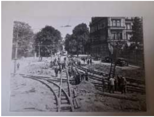
Werken aan de tramsporen rond 1930 op het kruispunt Generaal Lemanstraat-Jan Van Rijswijcklaan.