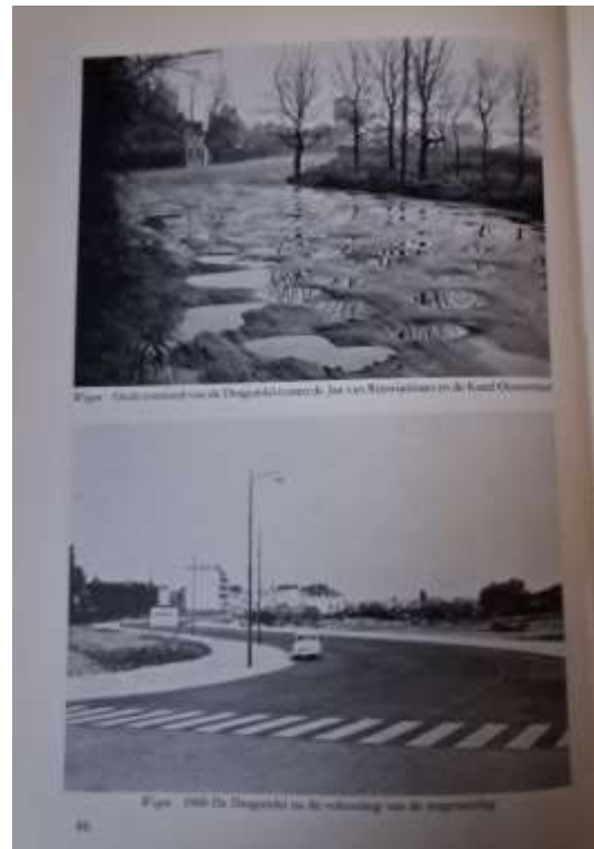
Desguinlei tussen Karel Oomsstraat van aardeweg naar asfaltweg. Aanleg 1957-1960