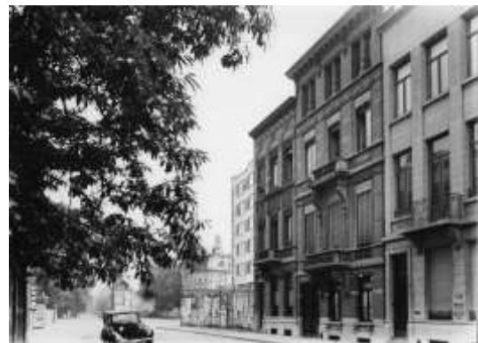
Doornelei na 1934