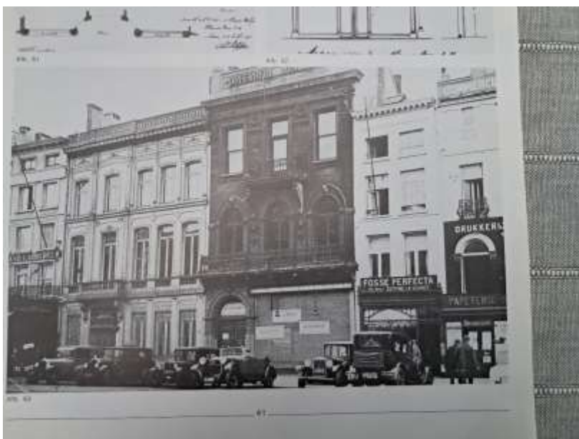
Stadswoningen van de familie Dumont op de Meir 22-24. De donkere gevel is een ontwerp van architect E. Stordiau.