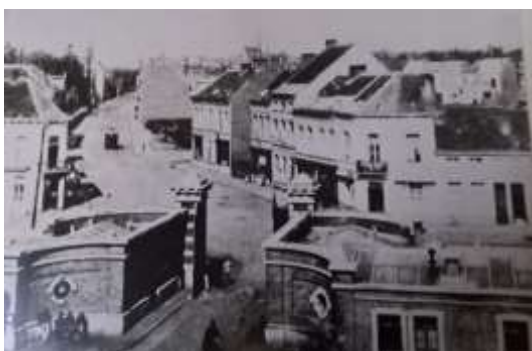
Toegang Masschelinkazerne aan de Generaal Lemanstraat. Afgebroken voor de verbreding van de Desguinlei 1957- 60.