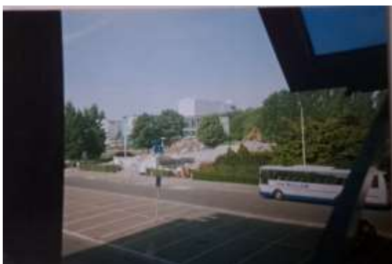
Middenbermparking Karel Oomsstraat. Van de wandelweg richting Nachtgalenpark is geen sprake meer.