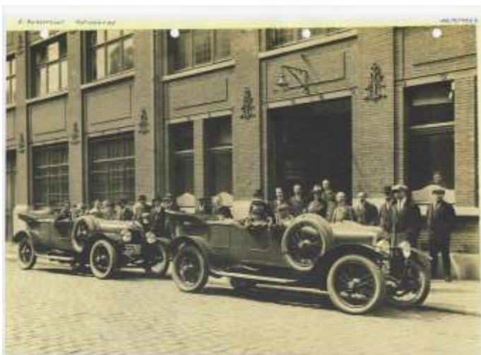
De Minerva autofabriek in de Karel Oomsstraat in haar glorieperiode 1919

In het project zit ook de aanleg van de Desguinlei tussen Generaal Lemanstraat en de Jan Van Rijswijkklaan. Het wachtlokaal van de Masschelinkazerne dient hiervoor afgebroken worden. De kazerne zelf wordt nog gebruikt als stadsmagazijn. De kazerne stond ter hoogte van de Generaal Lemanstraat. Nu oprijt Craeybeckxtunnel. De volkstuintjes van “Werk van de Akker” moeten ook verdwijnen en het oefenterrein voor ruiters van de manege Asselberghs wordt afgebroken. Deze manege bestaat nog steeds op Antwerpen Linkeroever.