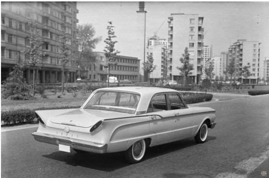
Moderne auto rond moderne architectuur in 1967