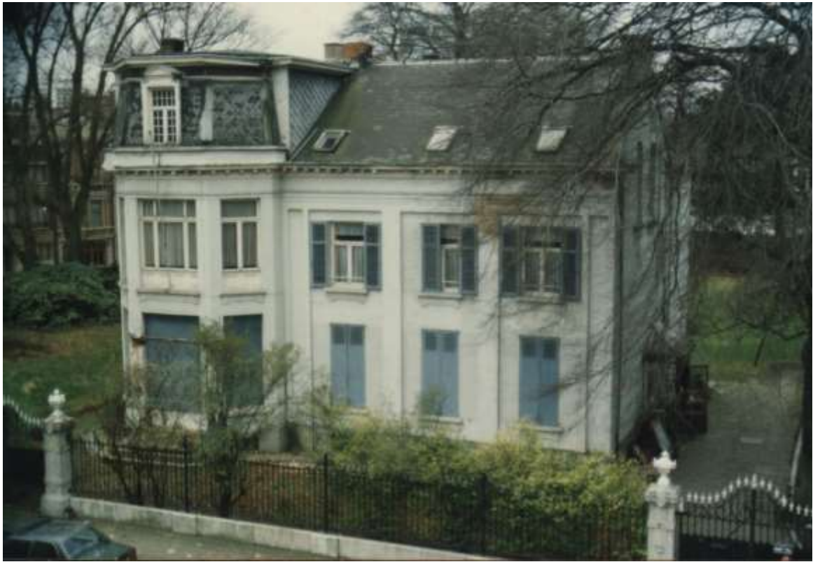
Hof van R. van Peten op de hoek van de Generaal Lemanstraat-Karel Oomsstraat Foto's december 1988.