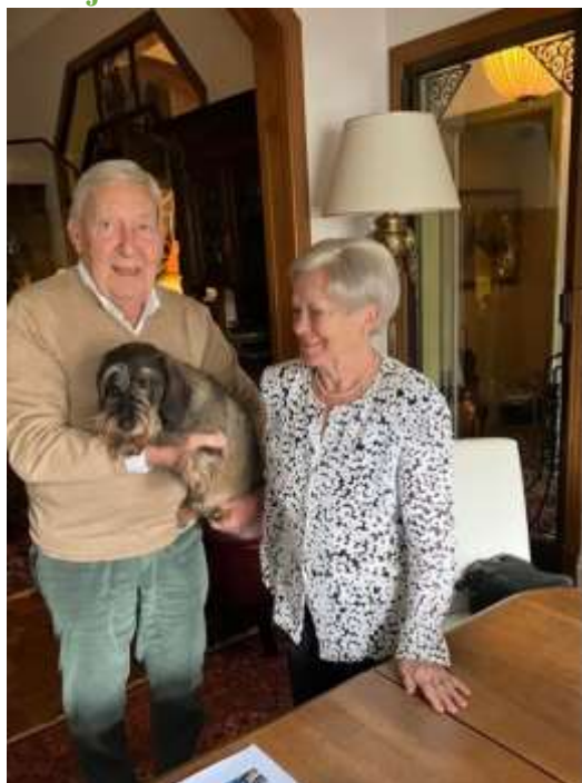
Karel Oomsstraat 6