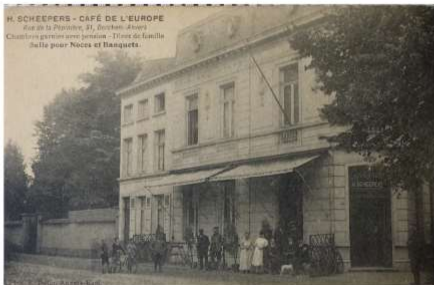
café De L'Europe tussen 1901 en 1912

Van Hombeeck bouwt op de hoek met de Karel Oomsstraat een nieuw gebouw dat de naam café De L'Europe krijgt. Het gebouw heeft maar 25 jaar bestaan. Aangrenzend in het Doorneleitje stonden nog 6 volkswoningen.