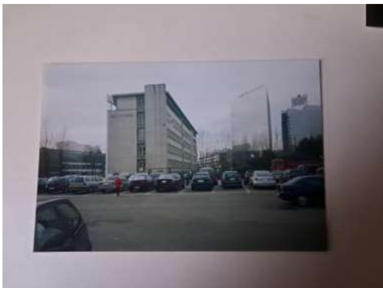
Kinderziekenhuis Louise Marie. 1959- 1997