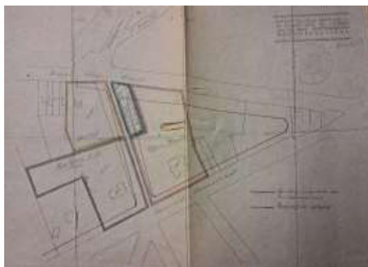
Boordeigenaars Doornelei 1925