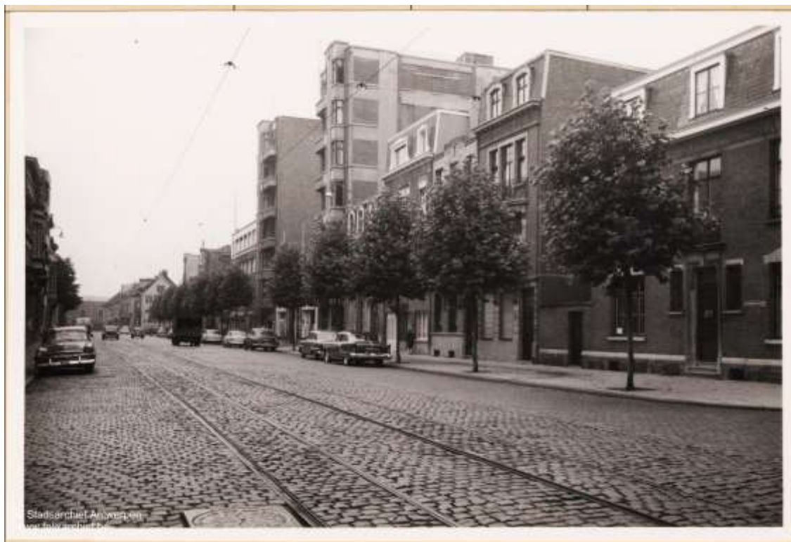
Generaal Lemanstraat in 1957 met de twee appartementsgebouwen ontworpen door Benoit Dupont. Felixarchief SA029023