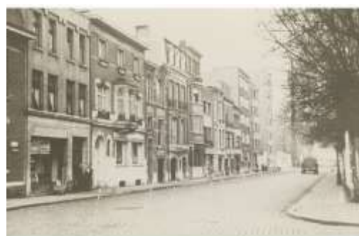
Doornelei in 1952