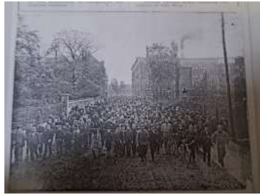
Werknemers verlaten de Minervafabriek in de Karel Oomsstraat in 1907.