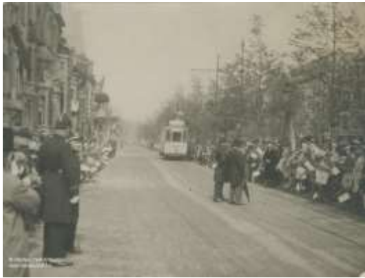
Jan Van Rijswijkklaan met tramlijn aan de buitenzijde van de wandelweg. Wachtende mensen om de koning en de koningin toe te juichen. Felixarchief Foto#11753